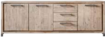
Dressoir 3 deuren, 3 laden H80xB193xD45cm